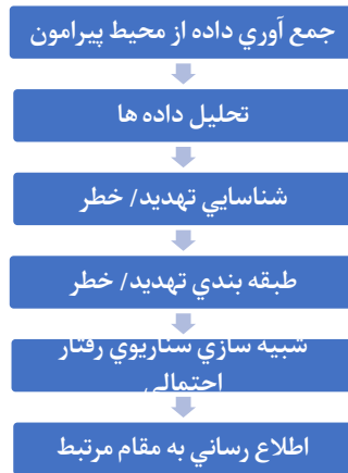
شکل ۱- نحوه عملکرد سیستم هوش مصنوعی در تحلیل خطر

بنابراین روش‌های پیش‌بینی در چهار دسته قابل شناسایی است: ۱- روش‌های پیش‌بینی جرایم ۲- روش‌های پیش‌بینی مجرمان ۳- روش‌های پیش‌بینی هویت مجرمان ۴- روش‌های پیش‌بینی قربانیان جرم